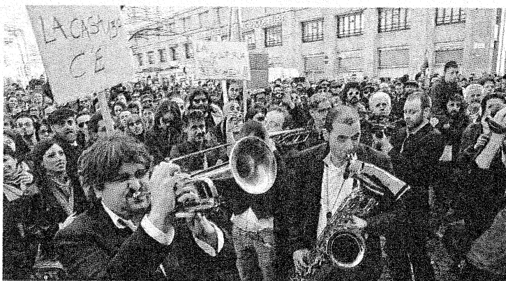
Lo spettacolo in piazza Fontana per difendere la musica